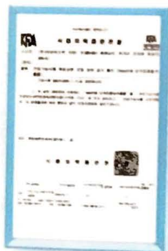
Certificado de Aprobación Individual