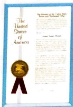
Patentes en EE. UU., Japón, Inglaterra, Francia, Alemania e Italia